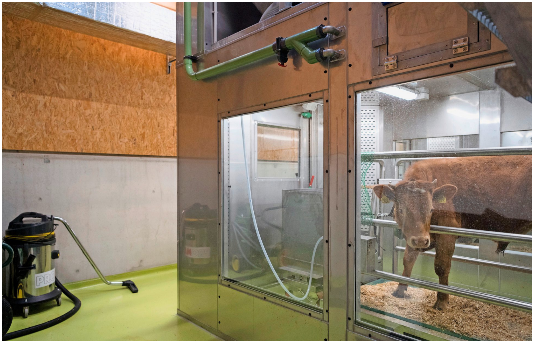
Bei dem jungen Muni werden die Atemgase sowie auch das Methan aus dem Verdauungstrakt 48 Stunden lang in der Respirationskammer gemessen.

Das Gas bildet sich im Pansen. Dort spalten Bakterien und Geiseltierchen die Fasern der Gräser auf und produzieren dabei Wasserstoff. «Um diesen zu entsorgen, wandeln Mikroorganismen ihn in Methan um», sagt Kreuzer, dessen Team auch Futterzusätze testet, um den Ausstoss des Methans zu senken. Dies sei nicht ganz einfach, da das Verdauungssystem bei Wiederkäuern sehr komplex sei und die Verdaulichkeit des Futters sowie auch die Produktivität der Tiere nicht negativ beeinflusst werden sollten.